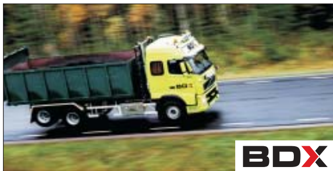
Om bakgrunden är orolig bör logotypen placeras på en vit eller svart bakgrund.

BDX SMÅ NÄR DET BEHÖVS. STORA NÄR DET KRÄVS.